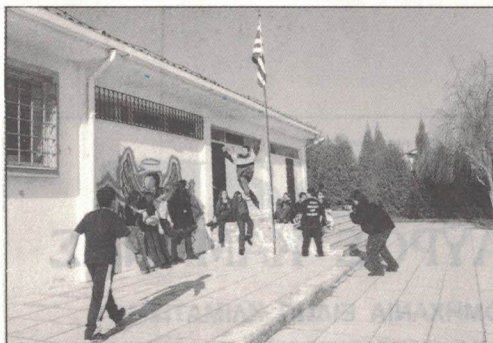
Σκηνή από την ταινία στο προαύλιο του Γυμνασίου