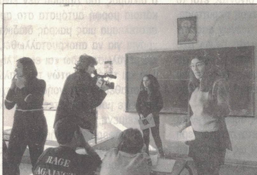
Φώτα, κάμερα, πάμε...

Έτσι λοιπόν 62 ομάδες από Γυμνάσια και Λύκεια της Αθήνας και της Θεσ/νίκης που μετείχαν στο πρόγραμμα γύρισαν πεντάλεπτες ταινίες γύρω από τη σχολική ζωή και δραστηριότητα. Μαθητές ηθοποιοί, σκηνοθέτες, κάμεραμεν, τεχνικοί και γενικά όλες