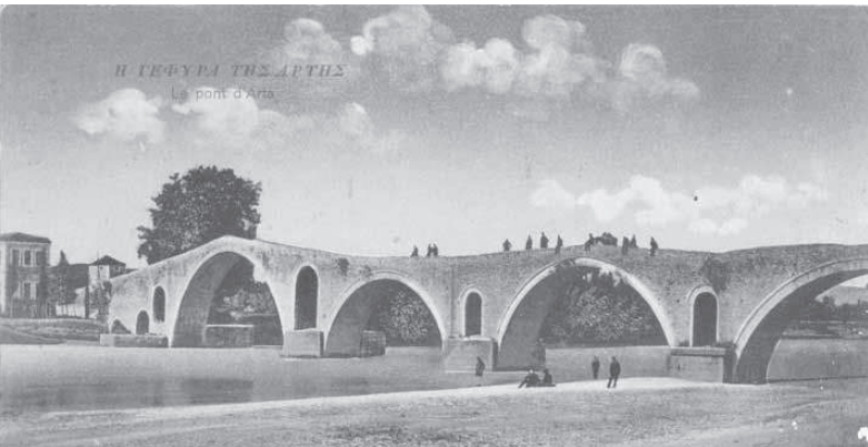
Το γεφύρι, 1910.