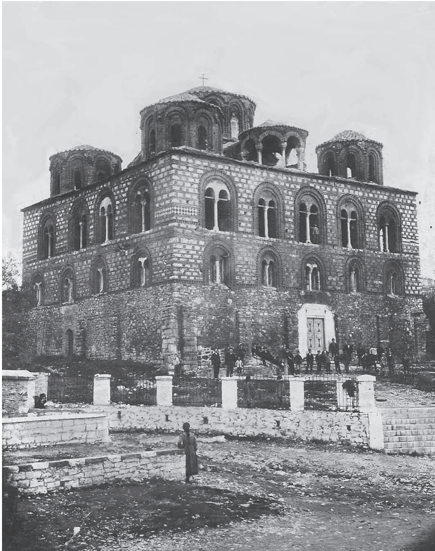
Ο ναός της Παρηγορήτισσας, 1917.