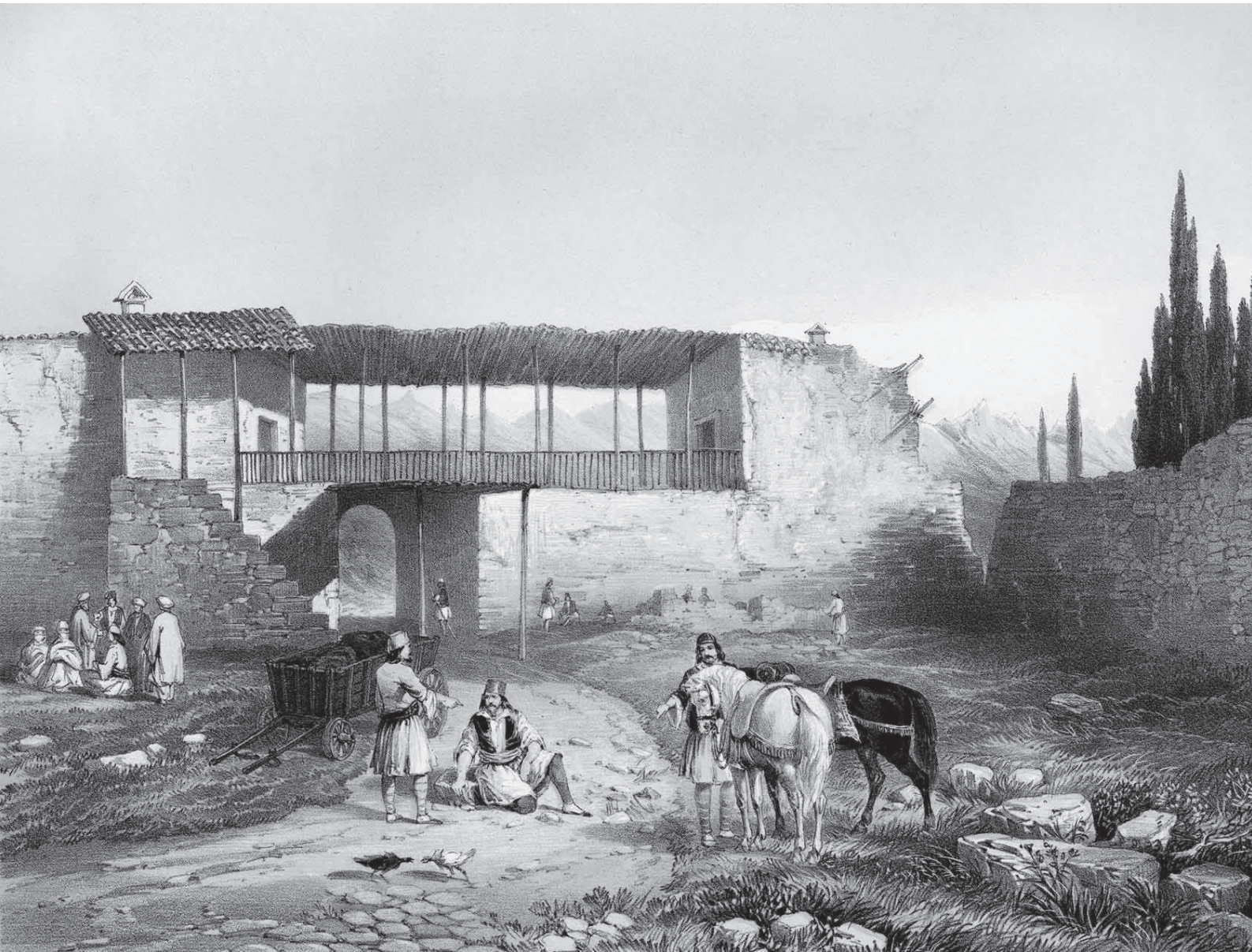
Το χάνι του Καρβασαρά κοντά στο χωριό Γοργόμυλος, 1855.