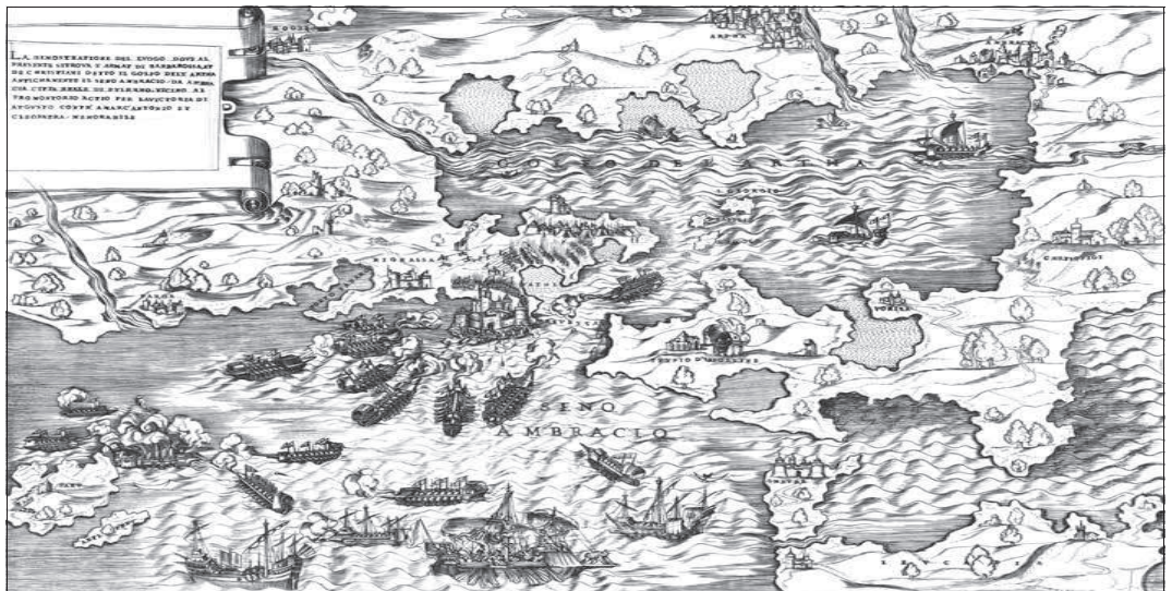
Καλλιτέχνης Antonio Salamanca, 1540.

χωρήσουν άτακτα προς την κατεύθυνση της Άρτας. Αφού ανασυντάχθηκαν, ξαναπέρασαν τον Άραχθο το πρωί της 12ης Οκτωβρίου και βρήκαν κενή από τον τουρκικό στρατό όλη την περιοχή μέχρι και τη Φιλιπιάδα, την οποία κατέλαβαν το ίδιο απόγευμα. Στο μεταξύ ο στρατός της Ηπείρου, ενισχυμένος με δύο τάγματα του ανεξάρτητου συντάγματος Κρητών που