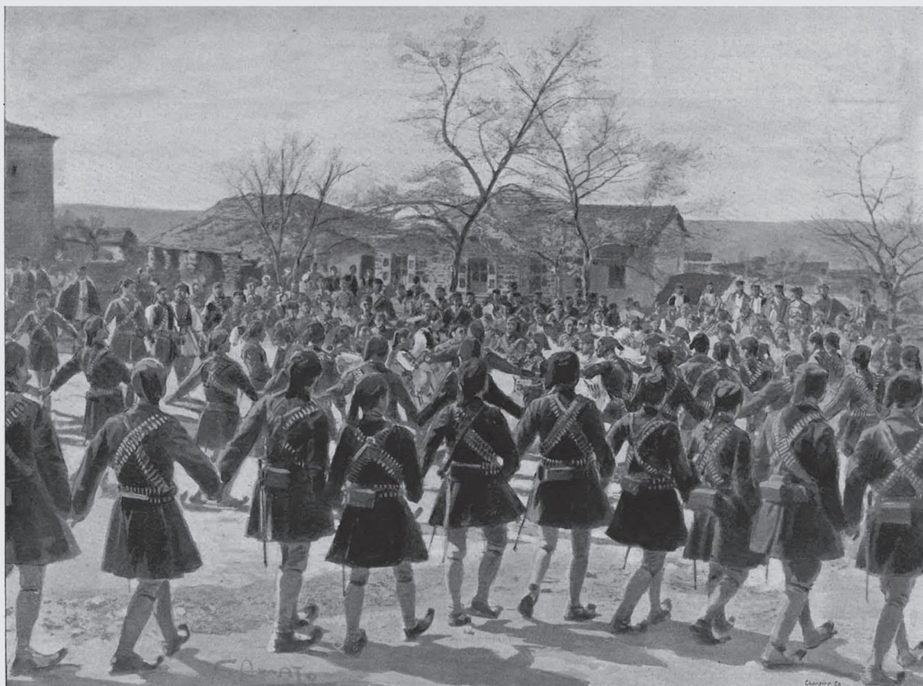
Soldats grecs (evzones) dansant le « tsamiko », à Péta.

D'après des photographies de notre correspondant, M. Pierre Quillard. (Voir l'article à la page précédente.)