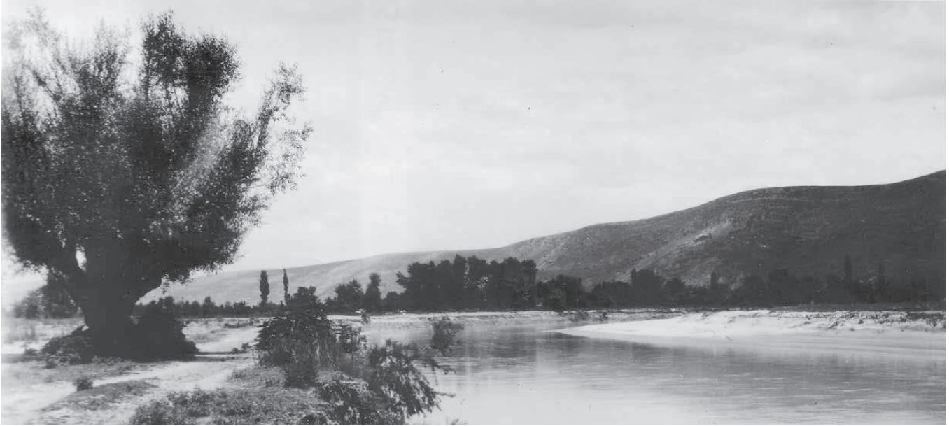
Ο ποταμός Αραχθός από τη νότια πλευρά. Παχυκάλαμος Άρτας, 1931.