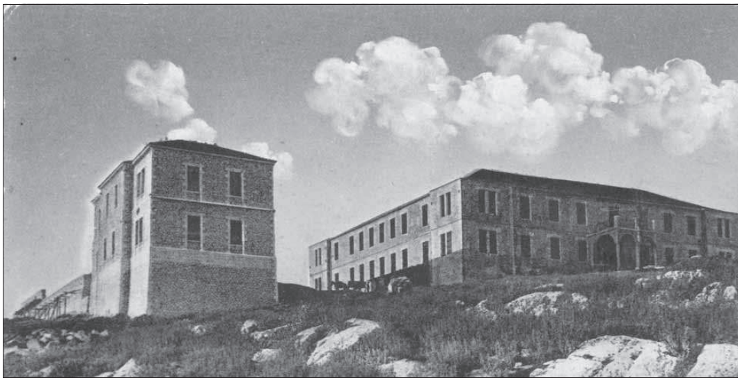
Ο Αμουντικός Στρατώνας, 1905.

Η περίοδος του Μεσοπολέμου (με την έννοια μεσοπόλεμος αναφερόμαστε στη χρονική περίοδο μεταξύ Πρώτου και Δευτέρου Παγκοσμίου Πολέμου, κυρίως μεταξύ 11ης Νοεμβρίου 1918 και 1ης Σεπτεμβρίου 1939), αναμφίβολα ταραγμένη πολιτικά, είχε