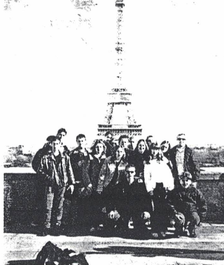
Με φόντο τον Πύργο του Άιφελ