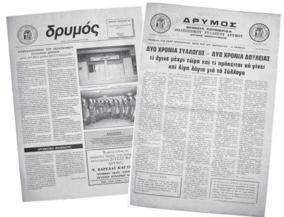
Δεξιά: Το πρώτο φύλλο της εφημερίδας (Γενάρης 1979) Αριστερά: Το πρώτο φύλλο της επανέκδοσης (Ιανουάριος 1997)

Ο Π.Σ.Δ. ανέπτυξε έντονη δραστηριότητα. Ασχολήθηκε και με την παράδοση, αλλά το κυριότερο και πολύ σημαντικό είναι ότι ανέπτυξε και μια έντονη δραστηριότητα με κοινωνικά χαρακτηριστικά. Ο χώρος του συλλόγου γέμισε καθημερινά από νέους ανθρώπους, είχε δημιουργηθεί το στέκι τους. Εκεί στεγαζόταν η δανειστική βιβλιοθήκη του Συλλόγου, αλλά το σημαντικότερο ήταν ότι εκεί με τις συζητήσεις αλλά και με τις συναναστροφές μεταδιδόταν μια γενικότερη κουλτούρα. Κάτι που σήμερα οι παλιότεροι το νοσταλγούν και εμείς οι νεότεροι προσπαθούμε να δημιουργήσουμε, αλλά πολύ φοβάμαι ότι έχει πλέον