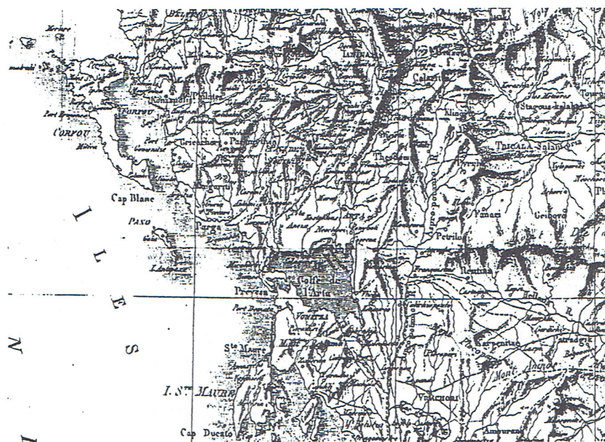
Τμήμα της Ηπείρου από το χάρτη της Ελλάδας του Rouqueville

επαρχίας του Ζαγορίου. Δύο λεύγες πριν χυθεί στον κόλπο της Άρτας διακλαδίζεται για να δημιουργήσει το δέλτα του ποταμού όπου το εύφορο και γόνιμο έδαφος χρησιμοποιείται για την καλλιέργεια καπνού και βαμβακιού. Η κυριότερη πόλη αυτής της μικρής επαρχίας ονομάζεται Terra-Nona, σύγχρονο όνομα που καταδεικνύει ίσως το νέο έδαφος πάνω στο οποίο ιδρύθηκε. Οι κάτοικοί της είναι στην πλειοψηφία Εβραίοι και εξόριστοι Βενετοί, αναμειγμένοι με μερικούς Έλληνες των βενετικών νησιών που μετέφεραν τα ήθη τους και την βιοτεχνία τους σ' αυτή τη γωνιά της γης, άξια ενός πιο ευγενούς πληθυσμού.