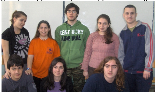
Οι ηθοποιοί μας

Ο εγωιστής Αγκάν αδιάκοπα ασχολείται με τον εαυτό του, βασανίζει τους άλλους γύρω του, παρατραβάει όμως τόσο το ελάττωμά του που στο τέλος εξευτελίζεται πέφτει θύμα αυτών που τον εκμεταλλεύονται και χάνει το σεβασμό των δικών του. Το έργο περιέχει όλα τα στοιχεία της φάρσας, κωμικότητα κατάστασης, κωμικότητα κίνησης και σάτιρας. Πρόκειται για μια απολαυστική κωμωδία που επιτρέπει όμως στο δημιουργό της να βυθίζει κάθε τόσο το ερευνητικό του βλέμμα στην ψυχή των ηρώων του και να ξεσκεπάσει τον χαρακτήρα τους. Μοχλός της δράσης η όλο ζωντανία υπηρέτρια που με την πονηριά της, τα ξεφωνητά της, τα τρεχαλητά της και τα γέλια της κινεί τα νήματα.