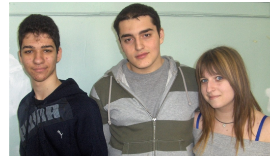
Η σκηνοθετική μας ομάδα

«Από την αρχή της προσπάθειάς μας, να ανεβάσουμε αυτό το δύσκολο έργο όλοι οι συντελεστές είχαμε σαν στόχο να γνωρίσουμε το θέατρο συμμετέχοντας σε αυτό μέσα από συλλογική δουλειά. Όλοι μας έχουμε αφιερώσει χρόνο και μεράκι στην παράσταση από την πρώτη στιγμή. Μέσα από αυτή την διαδικασία γνωρίσαμε το θέατρο με την στήριξη των καθηγητών μας οι οποίοι μας έδωσαν την ευκαιρία να δουλέψουμε πολλές φορές μόνοι μας και να μάθουμε τη συλλογική και προσωπική δουλειά και ευθύνη. Θέλω να ευχαριστήσω τους συμμαθητές, καθηγητές και γονείς που μας βοήθησαν σε αυτό μας το ταξίδι στον κόσμο του θεάτρου».