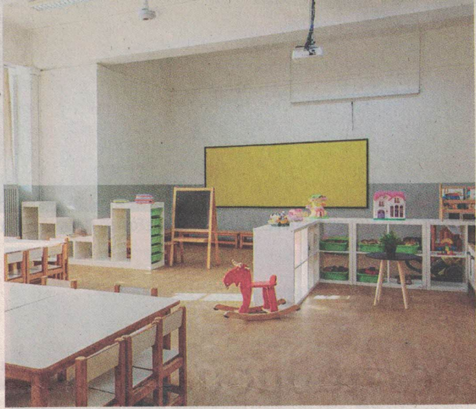
Το σχολικό κτίριο αναβαθμίστηκε αισθητικά και λειτουργικά, «ξαφνιάζοντας» ευχάριστα τους 452 μαθητές του.