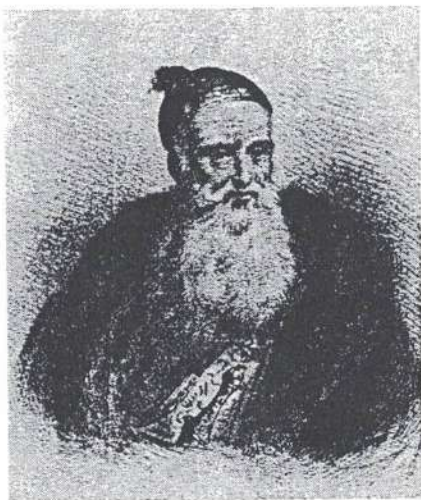
Ο Αλή Πασάς σε χαλκογραφία εποχής.

Τα προϊόντα βασικής κατανάλωσης, που παρήγαγαν τα νησιά ήταν πολυποίκιλα. Όμως το σιτάρι, το κριθάρι, ή το καλαμπόκι δεν επαρκούσαν για τη βιοτική τους ασφάλεια, ιδίως εκείνη της Κέρκυρας που εξαρτιόταν αποκλειστικά από τον έξω κόσμο όσον αφορά την εισαγωγή σιταριού. Το κρέας επίσης, προϊόν πρώτης ανάγκης για τον ανεφοδιασμό των νησιών, αποτελούσε αντικείμενο μαζικής μεταφοράς, όχι μόνο προς τους θαλάσσιους επτανησιακούς δρόμους και τον παράκτιο χώρο, αλλά και στο εσωτερικό του ηπειρωτικού χώρου. 18 Η Κέρκυρα π.χ. μετέφερε με επτανησιακά καράβια μια μεγάλη ποσότητα βοδιών από τα λιμάνια της Άρτας, της Πρέβεζας, του Καρλέλι και του Ξηρόμερου. Για να καταλήξουν στα παραπάνω λιμάνια, κοπάδια 60, 100 ή ακόμα 250 βοδιών, έρχονταν από όλη την περιοχή της Άρτας, των Ιωαννίνων, του Ξηρόμερου και της Κορι-