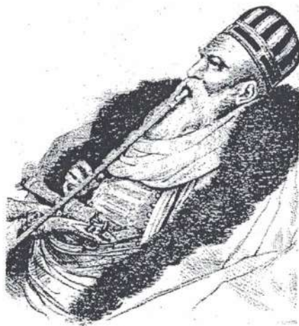
Αλή Πασάς, χαλκογραφία του Theophilus Richards (1823).

Για την Άρτα πρέπει να επισημάσουμε ότι περιήλθε στην εξουσία του Αλή Πασά το 1796. Ο Σεραφεΐμ