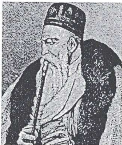
Ο Αλή Πασάς σε χαλκογραφία εποχής.

κτους πόρους ό,τι οι διαβάται επιλοδώρουν αυτούς 6 . Για λόγους εσωτερικής ασφάλειας επέβαλε τη χρήση διαβατηρίου (Teskere), που η κατοχή του ήταν απαραίτητη, τουλάχιστον, για τους μη εντόπιους και ακόμη για τη διατήρηση της δημόσιας τάξης είχε συγκροτήσει ειδικό αστυνομικό σώμα,